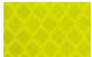
4083 Amarillo Limón Fluorescente