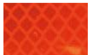
4084 Amarillo Naranja Fluorescente