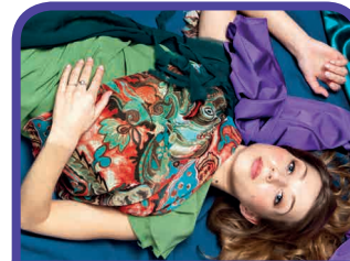
Moda y Complementos