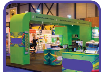
Gráfica para Ferias